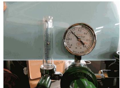
フロート式流量計(A)