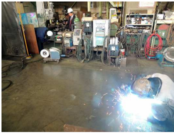
株式会社ダイヘン Welbee Inverter M500G