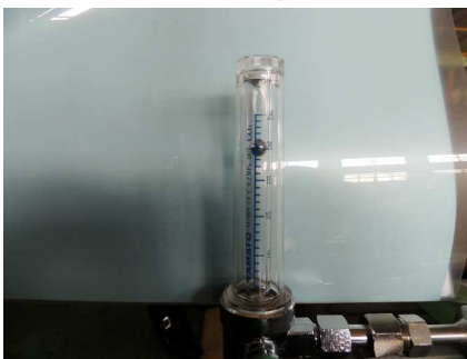
フロート式流量計(B)